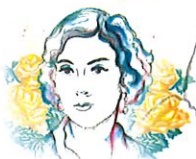
Ilustración: Noé Zenteno

2025, Año de la mujer indígena Año de Rosario Castellanos