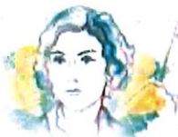
Ilustración: Noé Zenteno

2025, Año de la mujer indígena Año de Rosario Castellanos