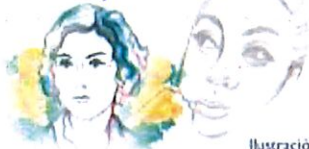
Ilustración: Noé Zenteno

2025, Año de la mujer indígena Año de Rosario Castellanos