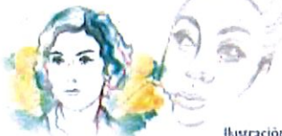
Ilustración: Noé Zenteno

2025, Año de la mujer indígena Año de Rosario Castellanos