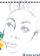
Ilustración: Noé Zenteno

2025, Año de la mujer indígena Año de Rosario Castellanos