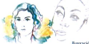
Ilustración: Noé Zenteno

2025, Año de la mujer indígena Año de Rosario Castellanos