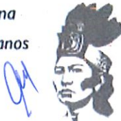
Ilustración: Noé Zenteno

2025, Año de la mujer indígena Año de Rosario Castellanos