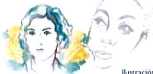
Ilustración: Noé Zenteno

2025, Año de la mujer indígena Año de Rosario Castellanos