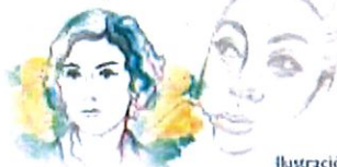
Ilustración: Noé Zenteno

2025, Año de la mujer indígena Año de Rosario Castellanos